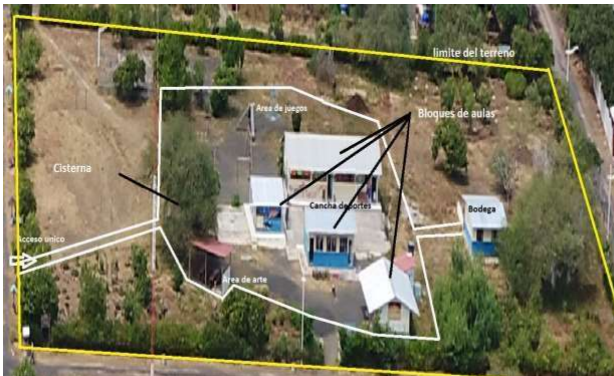
Imagen 1. Predio de escuela Amazonas con propuesta de cerramiento provisional

*Estaciones de cebo en los hogares. - La distribución de cebo de roedores en los hogares implicará poner cebo en las estaciones para evitar que la gente acceda directamente al cebo, requiriendo una llave para abrirlos. Esto reducirá el riesgo de contacto directo con el cebo. Toda la información sobre el cebo, los riesgos de ingerirla y el tratamiento si se ingiere accidentalmente se habrán compartido con toda la población por adelantado, junto con las fechas de distribución del cebo.